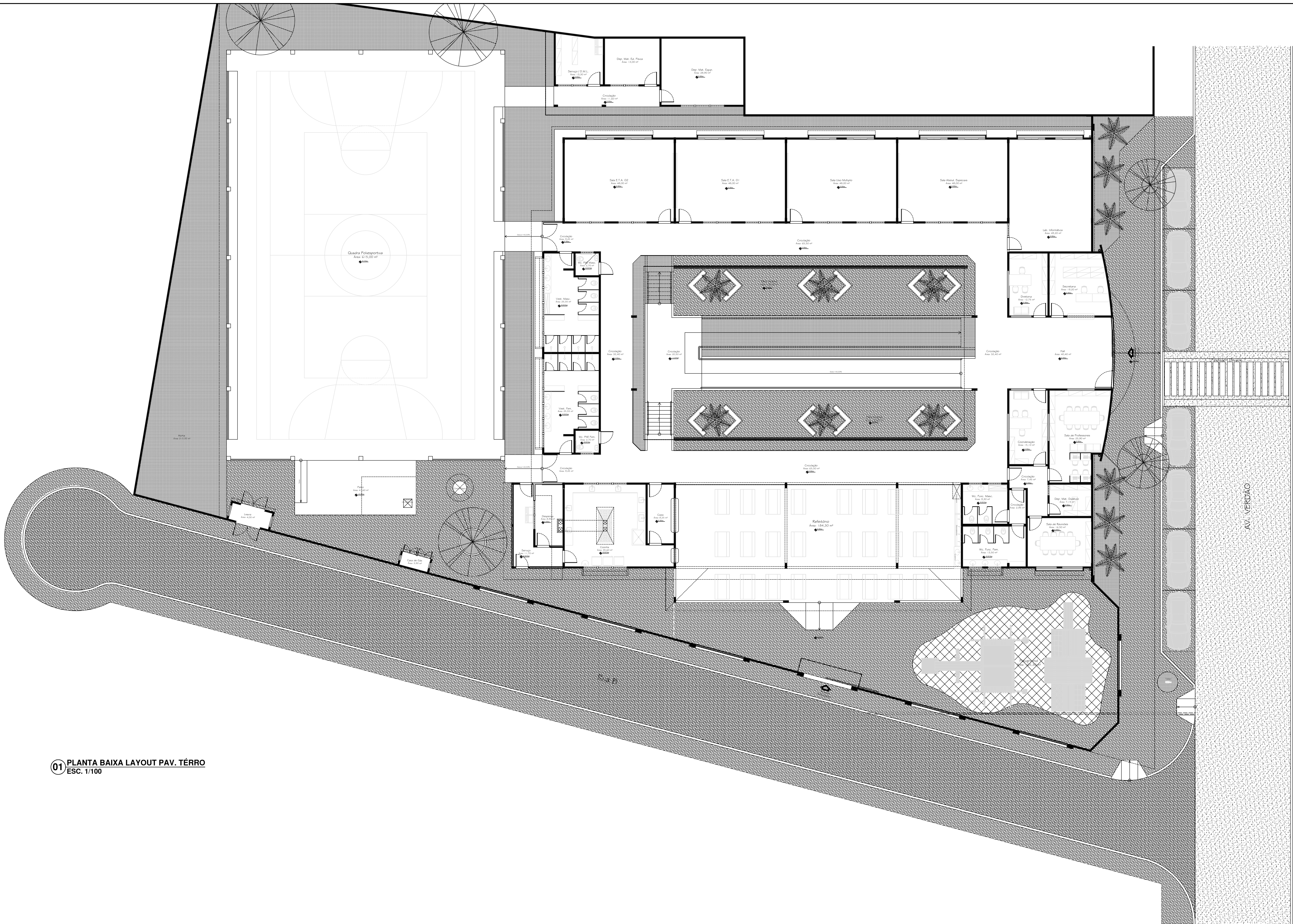
01 PLANTA BAIXA LAYOUT PAV. TÉRRO ESC. 1/100